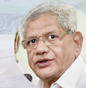
Sitaram Yechury Secretary General, Communist Party of India