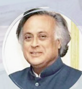
Jairam Ramesh Economist and Politician