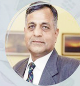
Ashok Lavasa Election Commissioner of India