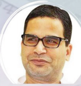
Prashanth Kishor Political Strategist and Politician