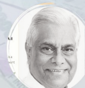
K. Padmanabhaiah Former Home Secretary, Government of India