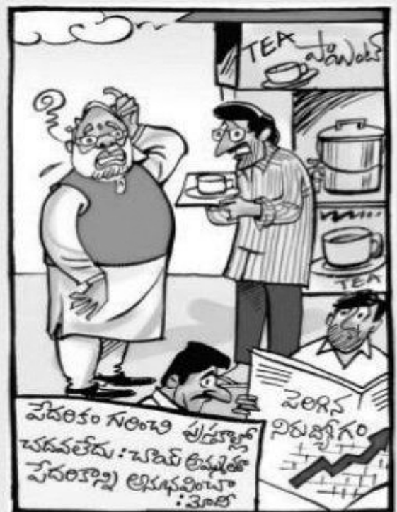
వేదరికం గురించి పీజీ వరకు చదివాను సార్... ఇప్పుడు టీ అమ్ముకుంటున్నా...!