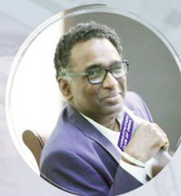
Justice Chelameswar Former Judge, Supreme Court of India