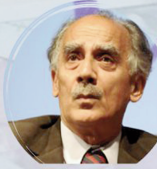
Arun Shourie Economist, Journalist, Writer and Politician