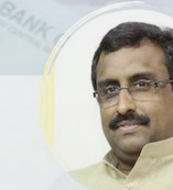
Ram Madhav National General Secretary, Bharatiya Janata Party