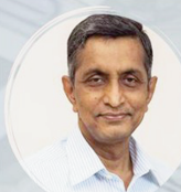
Jayaprakash Narayan Founder, Foundation for Democratic Reforms