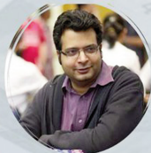
Amit Verma Writer, Columnist and Podcaster