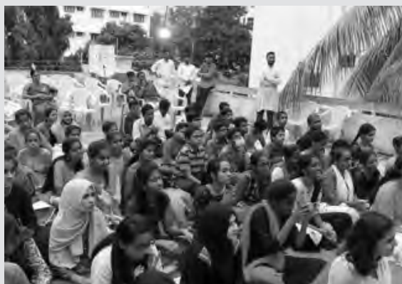
హైదరాబాద్ అంబర్పేటలో జరిగిన 'సోహం' లీడర్షిప్ కార్యక్రమంలో యువతతో ప్రజాస్వామ్య పీఠం (ఎఫ్డీఆర్), లోక్సత్తా వ్యవస్థాపకులు డా॥ జయప్రకాష్ నారాయణ్..