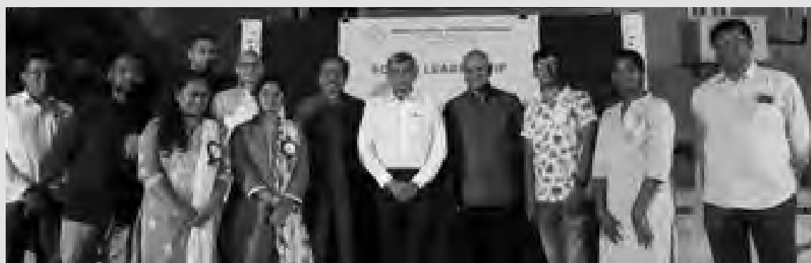
లోకసత్తా ఉద్యమ సంస్థ మాసపత్రిక