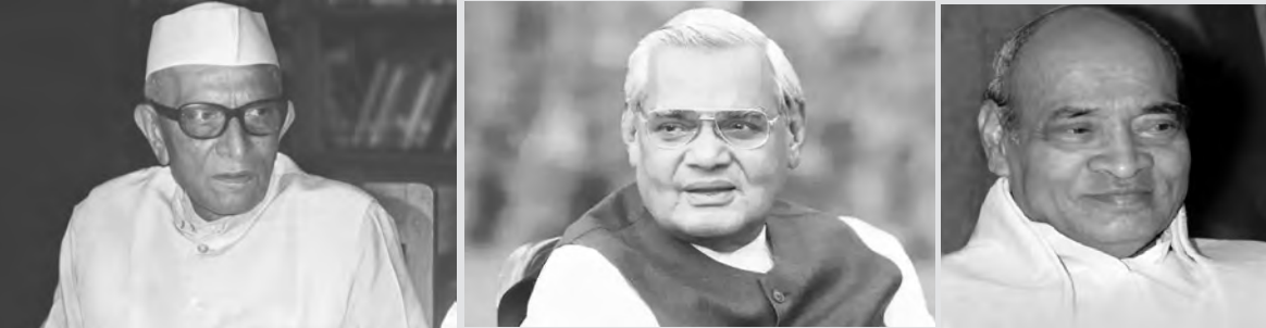
లోకసత్తా ఉద్యమ సంస్థ మాసపత్రిక

గతంలో పీవీ నరసింహారావు ప్రధానిగా ఉన్నప్పుడు, ప్రతిపక్ష నాయకుడిగా ఉన్న వాజ్ పేయి అనునిత్యం విమర్శించేవారు. కానీ, ఐక్యరాజ్యసమితిలో కాశ్మీర్ సమస్యపై మాట్లాడేందుకు దేశ ప్రతినిధిగా వాజ్ పేయినే నియమించి ఇదీ పీవీ తీవ్ర అని అందరూ ఆశ్చర్యపోయేలా చేశారు పీవీ. నెహ్రూ ప్రభుత్వాన్ని కూడా ప్రతిపక్ష సభ్యుడిగా వాజ్ పేయి విమర్శిస్తూనే ఉండేవారు. కానీ జనతా ప్రభుత్వం హయాంలో నెహ్రూ చిత్రపటాన్ని విదేశాంగ మంత్రిత్వ కార్యాలయం నుంచి తొలగిస్తున్నప్పుడు, వాజ్ పేయి అభ్యంతరం వ్యక్తం చేసి, ఆ చిత్రపటాన్ని మళ్లీ అదేచోట పెట్టించారు. అప్పటి నాయకుల్లో పరస్పర గౌరవం అలా ఉండేది. ఉమ్మడి ఆంధ్రప్రదేశ్ రాష్ట్ర శాసనసభలో, వావిలాల గోపాలకృష్ణయ్య లాంటి వారున్నప్పటి కాలంలో ట్రేజరీ బెంచీలకు చెందిన మంత్రులు, విప్లు ప్రతిపక్ష నాయకుల దగ్గరకు వెళ్లి వారడిగిన ప్రశ్నలకు ఎలాంటి సమాధానమిస్తే ప్రజోపయోగకరంగా ఉంటుందో చర్చించిన సందర్భాలు ఉన్నాయి. ఈ రోజుల్లో పారపాటున అధికార పార్టీ ప్రయత్నించినా, ప్రతిపక్షం సరైన స్ఫూర్తితో స్పందిస్తుందా అన్నది సందేహమే.