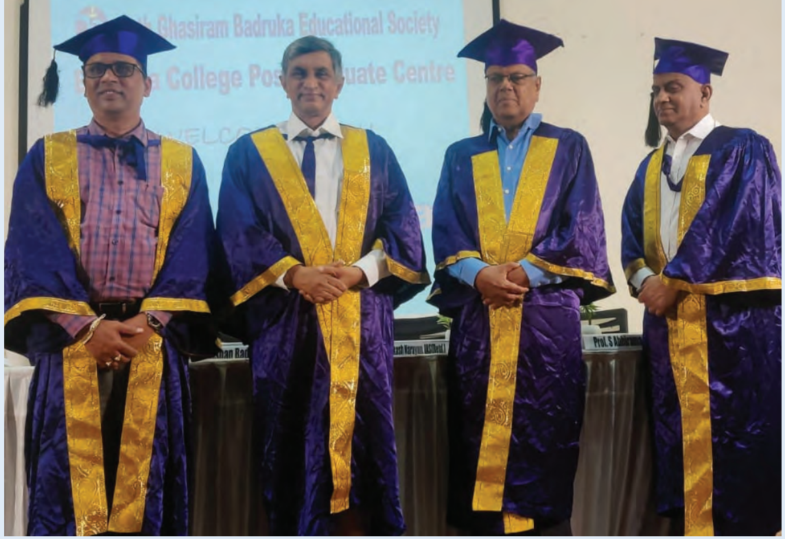
హైదరాబాద్ కాచిగూడలో బద్రుకా కళాశాల పీజీ సెంటర్ స్నాతకోత్సవంలో ప్రజాస్వామ్య పీఠం (ఎఫ్డీఆర్), లోక్సత్తా వ్యవస్థాపకులు డా॥ జయప్రకాష్ నారాయణ్