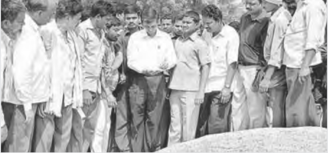
రైతు చైతన్య యాత్రలో భాగంగా జయప్రకాష్ నారాయణ్ 2011 లో కోదాడ మండలం గణపవరం, చిలుకూరు, పుజారీనగర్ మండలం బూరుగడ్డలో ఐకేపీ కేంద్రాలను, పుజారీనగర్, అవంతీపురంలలో మార్కెట్ యార్డులను సందర్శించిన సందర్భంగా ఓ దృశ్యం.