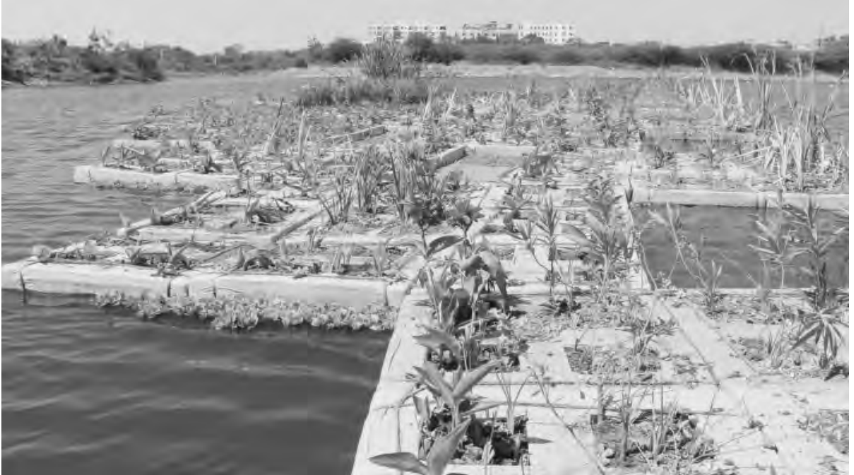
నెక్సాంపూర్ చెరువులోని తేలియాడుతూ శుద్ధి చేసే 'ఫ్లోటింగ్ ట్రీట్‌మెంట్ వెట్‌లాండ్'

శ్రవేగంగా పెరుగుతున్న పట్టణీకరణ వల్ల వెలువడుతున్న వ్యర్థజలాలు అనేక సమస్యలు సృష్టిస్తున్నాయి. వీటిని శుద్ధి చేసి తిరిగి వినియోగించటంపై దృష్టి పెట్టాలని నీతిఆయోగ్ సూచించింది. ఇప్పటికే మన దేశంలో పట్టణ ప్రాంతాల నుంచి వెలువడుతున్న మురుగు, వ్యర్థ జలాలతో నదులు, చెరువులు, భూగర్భ జలాలు తీవ్రంగా కలుషితమవుతున్నాయని 'అర్బన్ వేస్ట్‌వాలర్ సినారియో ఇన్ ఇండియా' పేరుతో విడుదల చేసిన ఇటీవలి నివేదికలో స్పష్టం చేసింది. దేశవ్యాప్తంగా 323 నదుల్లో 351 చోట్ల నీటి కాలుష్యాన్ని కేంద్ర కాలుష్య నియంత్రణ మండలి పరీక్షించింది. 13 శాతం తీవ్రంగా, 17 శాతం మధ్యస్థంగా కాలుష్యం ఉన్నట్లు తేలింది. భారలోహాలు, ఆర్నినిక్, ఫ్లోరైడ్స్, విషపూరిత రసాయనాలున్నట్లు పలుచోట్ల గుర్తించారు. భూగర్భ జలాలు ఎక్కువగా కలుషితమైనట్లు తేలింది. దేశవ్యాప్తంగా ఉన్న 1195 శుద్ధిప్లాంట్లలో 102 పనిచేయటం లేదని గుర్తించారు.