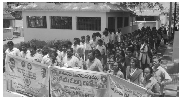
లోక్ సత్తా ఉద్యమ సంస్థ మాసపత్రిక