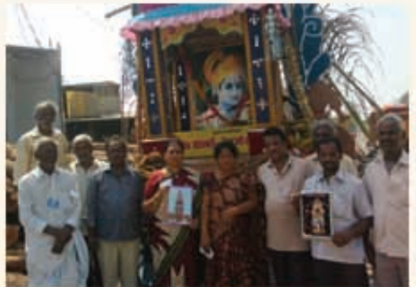
నర్సరావుపేటలో ప్రభల తయారీదారులతో...