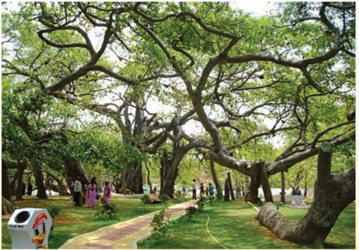
మహబూబ్ నగర్ జిల్లా పిల్లలమర్రిలో 700 సంవత్సరాల మర్రిచెట్టు