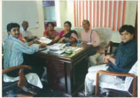
నర్సరావుపేట ఈశ్వర్ కళాశాలలో పార్టీ నిధుల పేకరణ బృందం