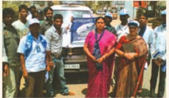
మహబూబ్ నగర్ ఉప ఎన్నికల ప్రచారంలో పార్టీ కార్యకర్తలు