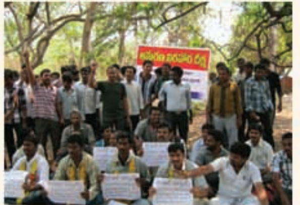
విశాఖపట్టణంలో మోడల్ స్కూల్ నియంధనలపై ఆందోళన