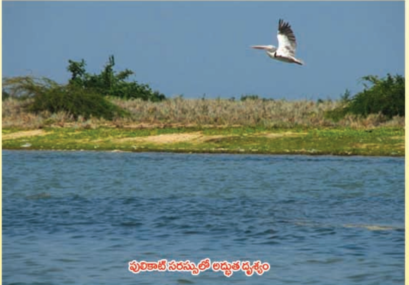
పులికాట్ సరస్సులో అద్భుత దృశ్యం